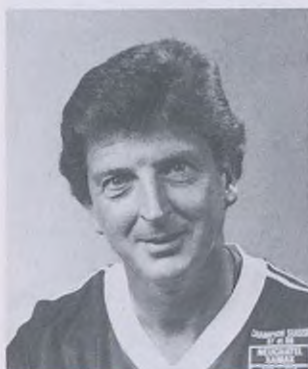
Roy HODGSON Entraîneur