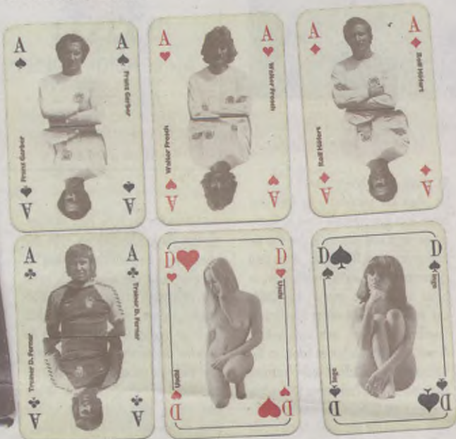
Uschi und die starken Männer: Die exakte Reproduktion des zeitlos bizarren Kartenspiels von 1976/77 gehört zu den Highlights der Sonderedition. Auch das „Ur-Wappen“ des FC St. Pauli gehört zu den Extras