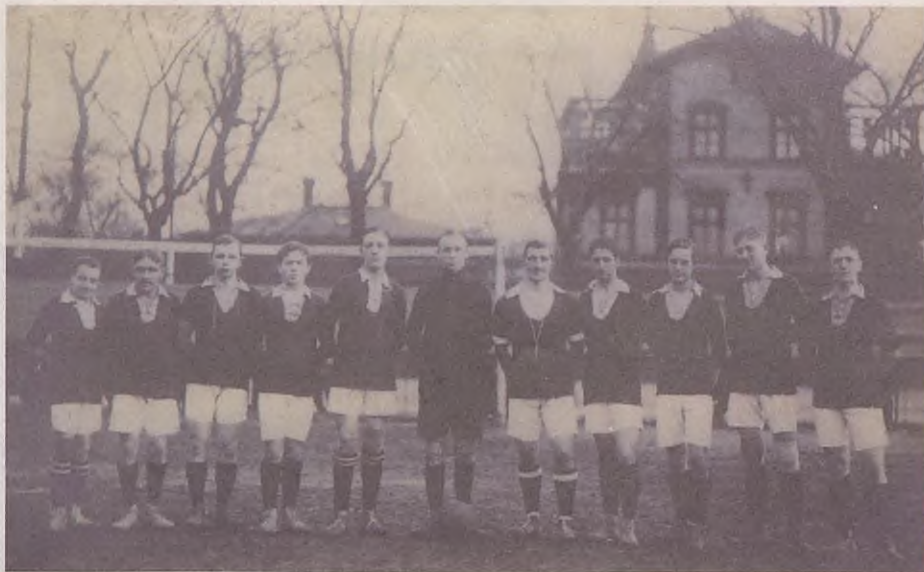
Die 1. Fußballmannschaft des Hamburg-St. Pauli-Turnvereins im Jahre 1911. 1924 gliederten sich die Fußballer des Turnvereins aus und gründeten den FC St. Pauli.