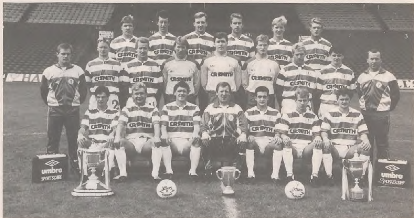
CELTIC GLASGOW F. C.

Hintere Reihe, v.l.n.r.: Mark McGhee, Billy Stark, Lex Baillie, Mick McCarthy, Anton Rogan, Derek Whyte;